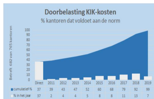
Afbeelding 2: Doorbelasting KIK-kosten

Toelichting: Bij de vraag over de doorbelasting van KIK-kosten is de laatste jaren een sterke stijging zichtbaar van notarissen die aangeven aan de normen te voldoen. Met name vanaf 2017, na extra aandacht voor het declareren van KIK-kosten.